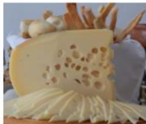
Productores de queso artesanal