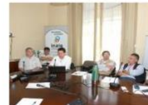
Representantes de los Ministerios: MGAP - MIEM MRREE - MEF